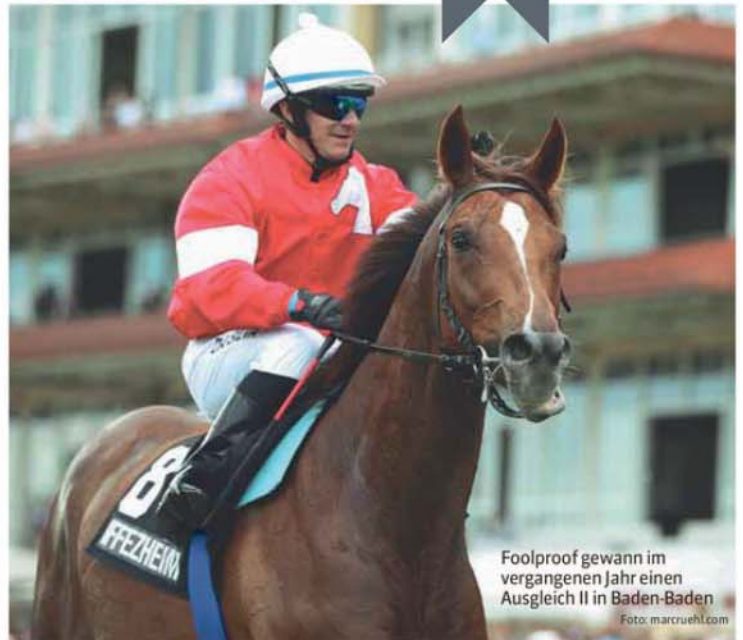
Foolproof gewann im vergangenen Jahr einen Ausgleich II in Baden-Baden

Bodenvorlieben: Unabhängig Distanz: Bis 1600 Meter Saisonziel: Höchstmögliches GA für die Zucht zu erzielen Besonderheiten: Absolute It's Gino-Tochter, unkomplizierte und sehr ehrliche Stute